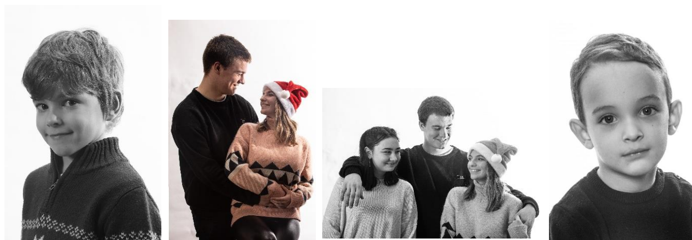
Jamais deux sans trois